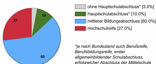
Ausbildungsanfänger/innen 2019 (in %)